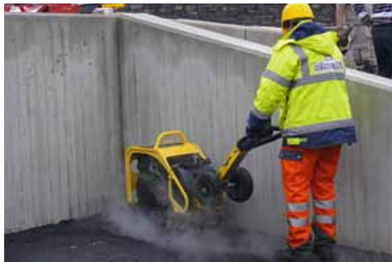
...für den Einsatz auf Asphalt.