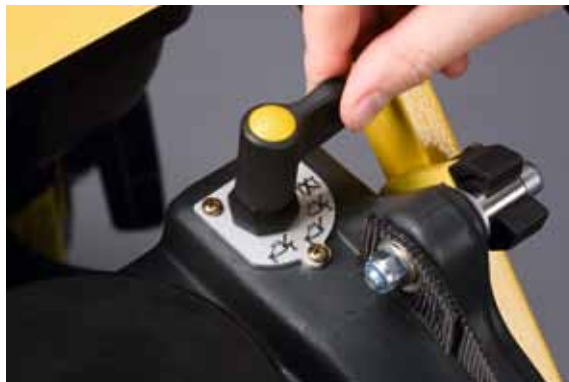
Wasserberieselung (optional): Wassermenge einfach und präzise dosierbar...

einen maximalen Schutz der Komponenten auch vor Vandalismus und sichert somit die höchste Verfügbarkeit der Maschine.