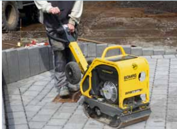
... und stets an der Maschine.

einen maximalen Schutz der Komponenten auch vor Vandalismus und sichert somit die höchste Verfügbarkeit der Maschine.