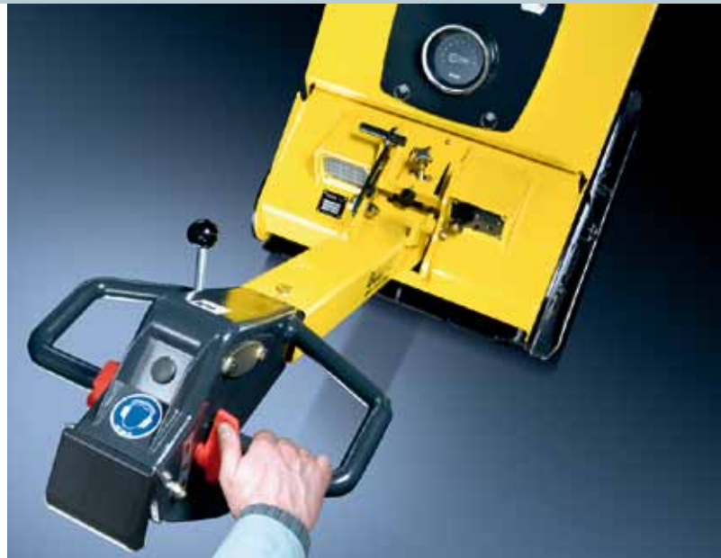
Einfach und komfortabel bedienbar mit serienmäßiger Tip-Control.