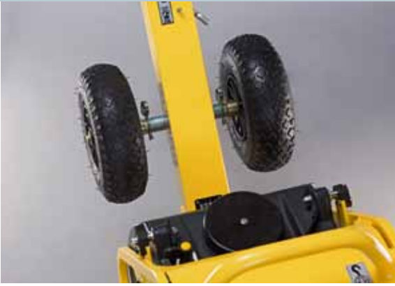
Transporträder (optional): Einfach in der Handhabung ...