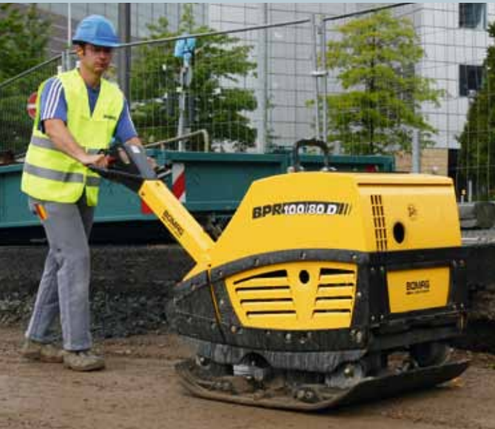
BPR 100/80 D überzeugt durch höchste Verdichtungsleistungen im Erdbau.