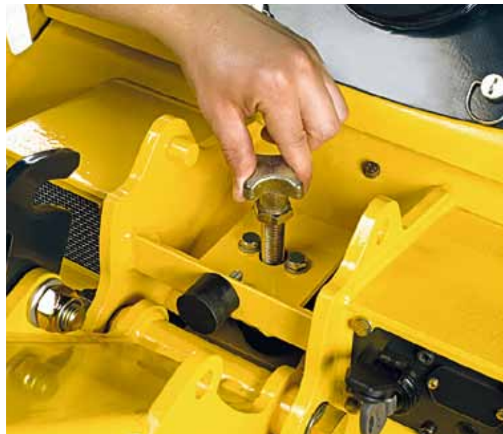
Höhenverstellbare Deichsel: standardmäßiger Komfort bei allen BPR Platten.