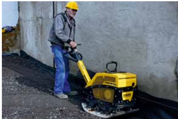
BPR 35/60D mit optionaler Vollschutzhaube für maximalen Schutz vor Beschädigungen.