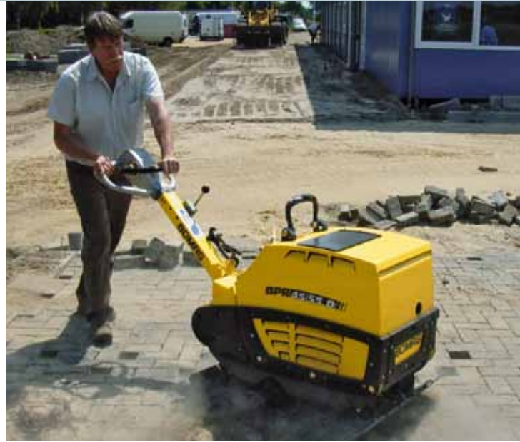
Mit Kunststoffmatte (optional) besonders gut geeignet für den Pflasterbau.