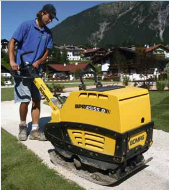
Flexible Maschinen für vielfältige Einsatzmöglichkeiten.