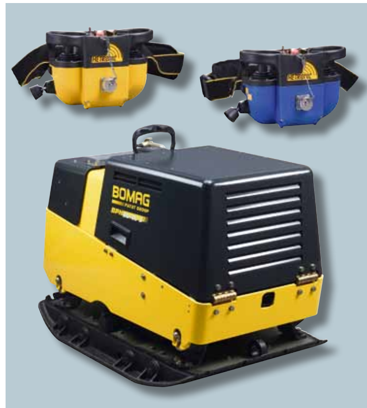
BPH 80/65S – Fernsteuerbar für höchste Sicherheit des Bedieners.