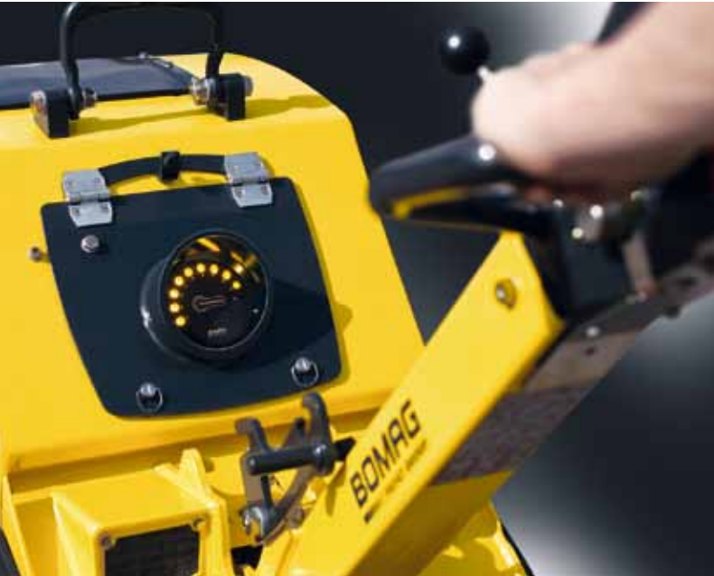
ECONOMIZER – Optionale Verdichtungskontrolle für reversierbare Vibrationsplatten ab 45 kN.